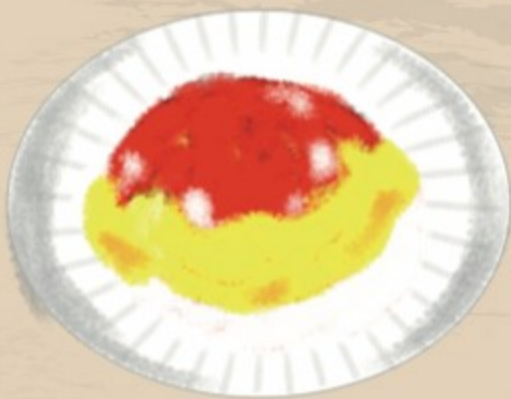
カキマッコ 863円(税込950円)