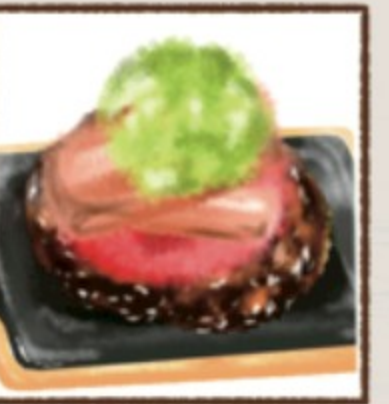
アボカドビーコントマト