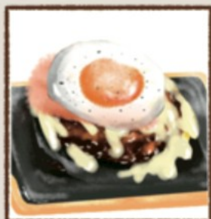
ベーコン月見チーズ

ハンバーグもお選びいただけます。全21種類! ※オーダーを頂いてから焼くため、調理に15分前後お時間をいただきます※