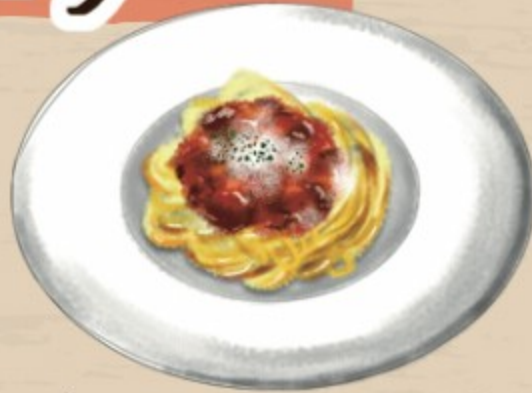
特製ボロネーゼパスタ 900円(税込990円)