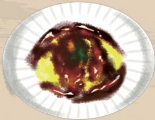
デミグラスソース 900円(税込990円)