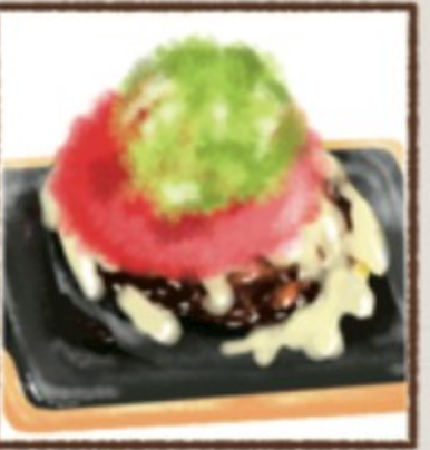
アボカドトマトチーズ