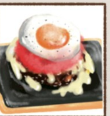
月見トマトチーズ