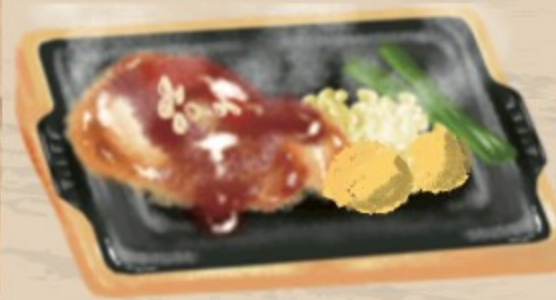
照焼ガーリック 1090円(税込1200円)