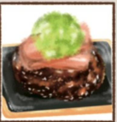
アボカドビーコン