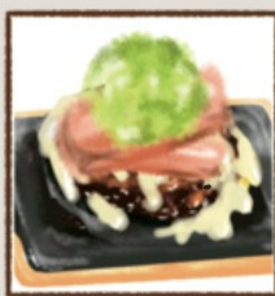
アボカドベーコンチーズ