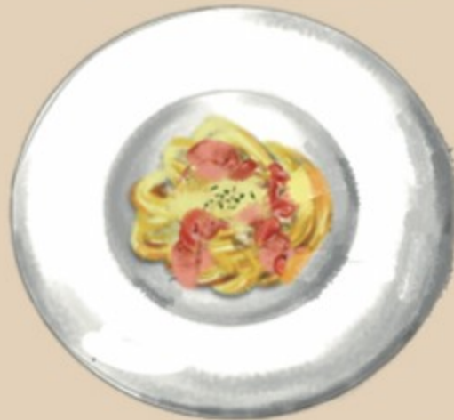
CoCoのペペロンチーノ 863円(税込950円)