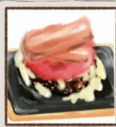
ベーコントマトチーズ