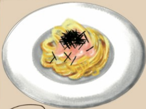
大葉おろし 明太クリームパスタ 863円(税込950円)