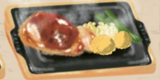
和風すりおろし 1090円(税込1200円)