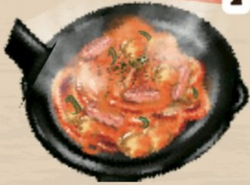
鉄板ナポリタン 900円(税込990円)