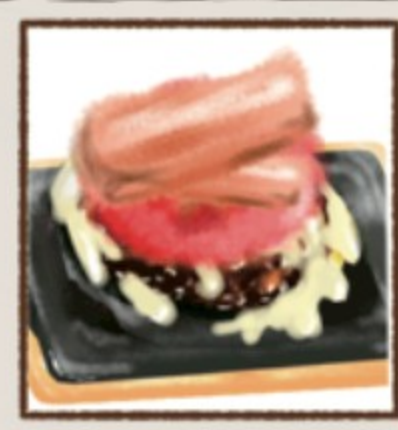
ベーコントマトチーズ 318円(税込350円)