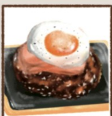
月見ベーコン 272円(税込300円)