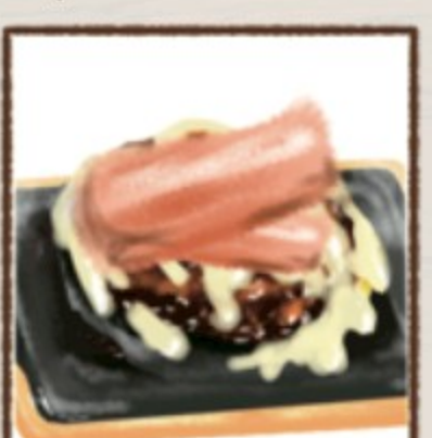
ベーコンチーズ 272円(税込300円)