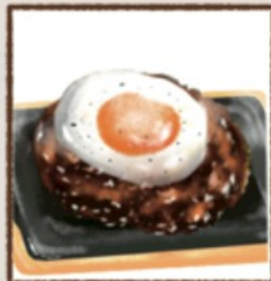
月見のせ 181円(税込200円)