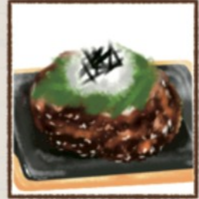
大葉おしろ 181円(税込200円)