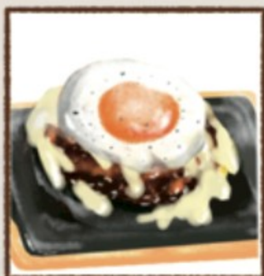
月見チーズ 272円(税込300円)