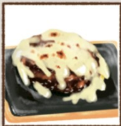
あぶチーズ 181円(税込200円)