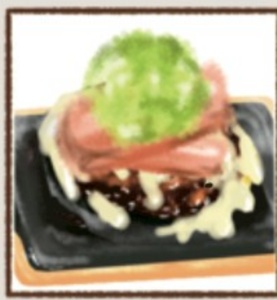
アボカドベーコンチーズ 318円(税込350円)