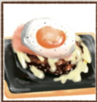
ベーコン月見チーズ 318円(税込350円)